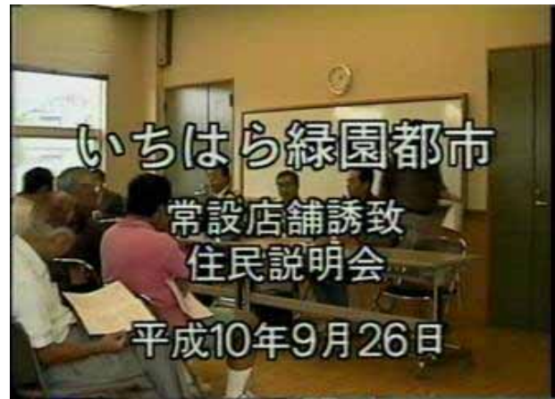
バブル崩壊。スーパーあおば閉店後の 店舗誘致住民説明会