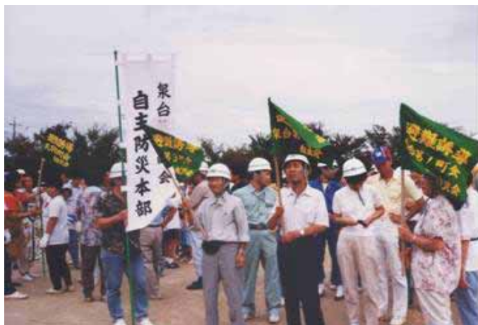
H7.9.3防災訓練 会場は南小