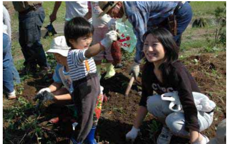
H16いずみ文庫の子ども達と芋掘大会