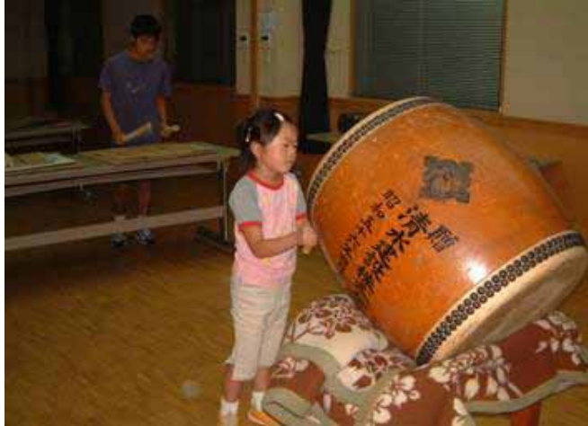
H15祭り太鼓の叩き手を育てよう、祭り前の練習です。