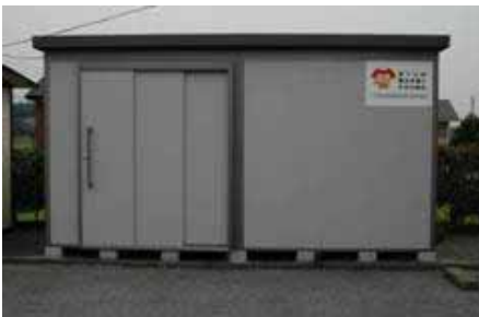
H18宝くじ助成金で音響装置、太鼓、倉庫を配備