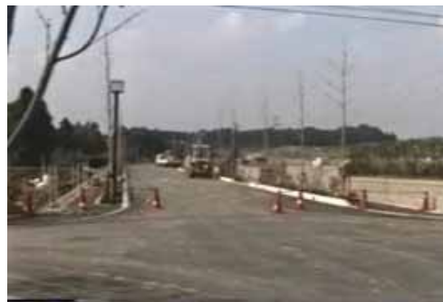
あけぼの坂を上って、2丁目方面