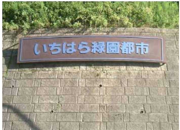
“andする街”の入口に設けられたモニュメント 「明るい幸せな未来を夢見る家族像」を象徴したブロンズ像とエンブレム