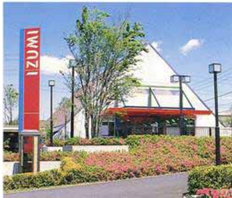
H2頃のスーパー「いずみ」 おしゃれな外観ですね