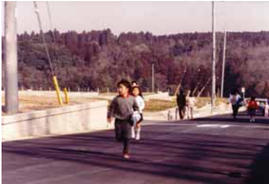
H3年のマラソン大会風景 2丁目造成地横を元気に走る子供達