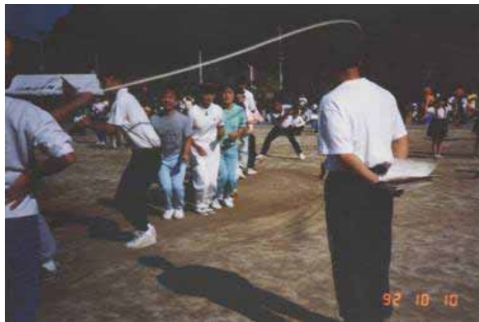
H4年の市民体育祭 会場は有秋中です。