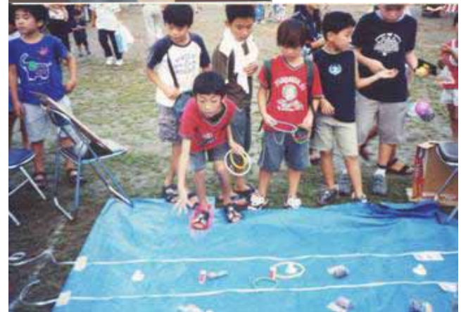
毎年、子供達が主役