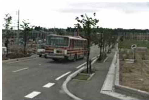
当時の周回道路、まだ街路樹も 小さかったです。