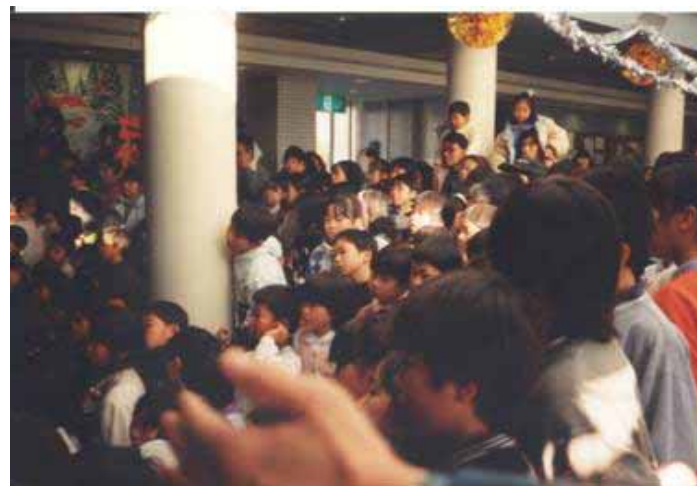
大勢の子供達で賑わってます。この子達は今、何歳かな～