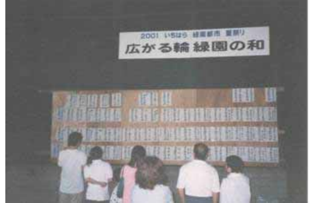
このスローガンは今でも続いています