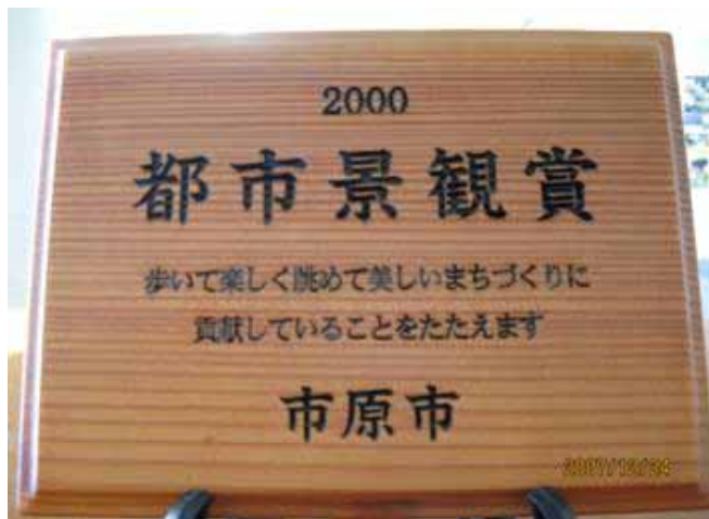
第1回市原市都市景観賞を受賞