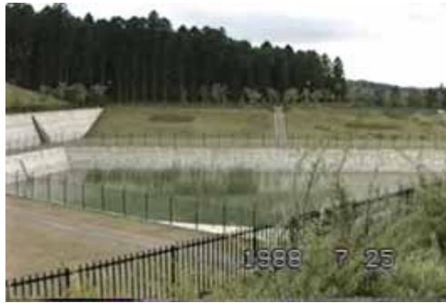
南側調整池 遠方に見える桜も小さいです