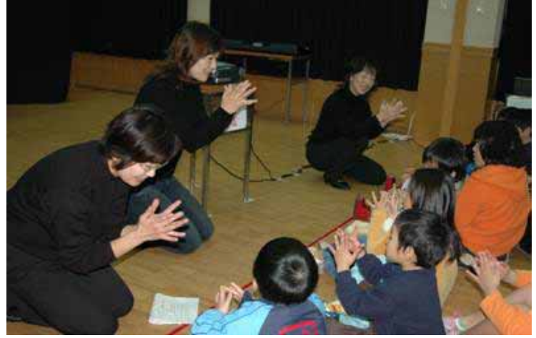
H16いずみ文庫 冬のおはなし会