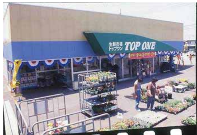
H11.5 当時の役員や支援する会のがんばりが 実ったスーパー誘致。トップワン開店