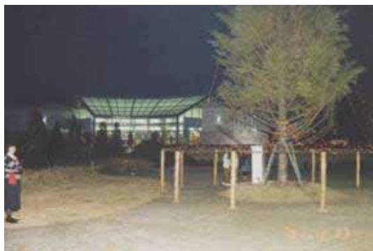
ホールとタセコイヤ 今はタセコイヤはありませんね!