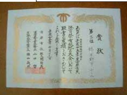
H15市民体育祭 3位入賞