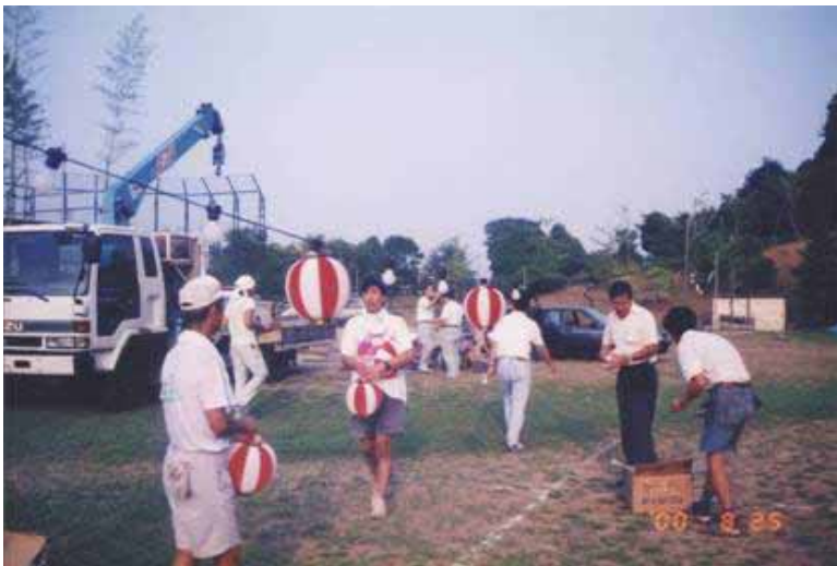
夏祭りの準備をする役員、前日からの準備です