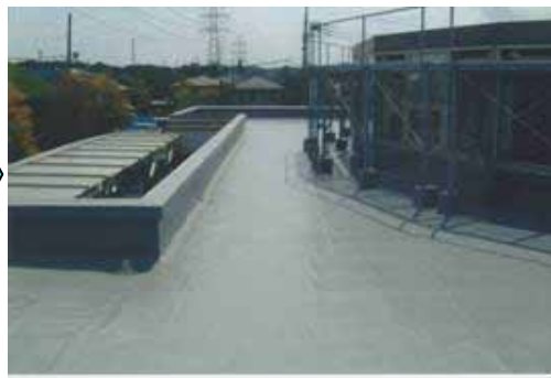
H18ホール屋上雨漏り修繕、排水管はほとんどが詰まっていた