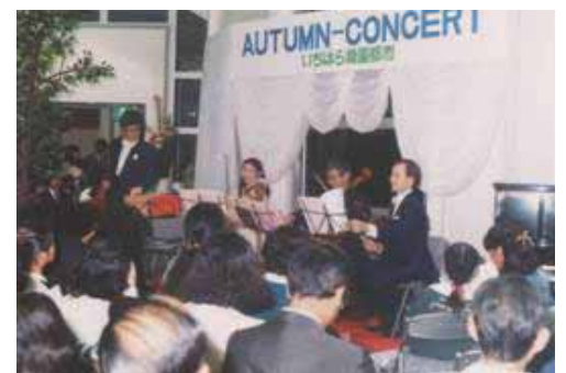
第1回オータムコンサート開催