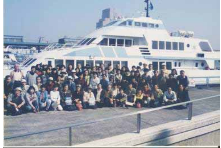
H9.10.19 アクアライン見学会 開催