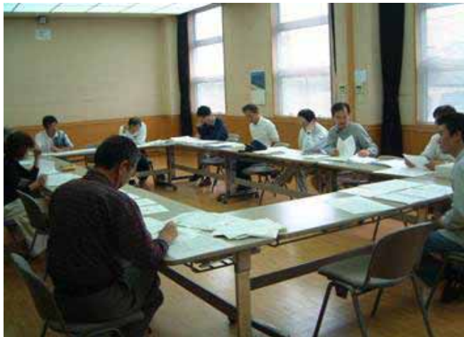
H15夏祭り実行委員会の開催模様