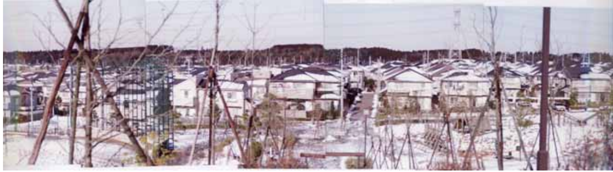
H4.2.1の降雪後の泉台 建設ラッシュにより4丁目完成2丁目建設開始