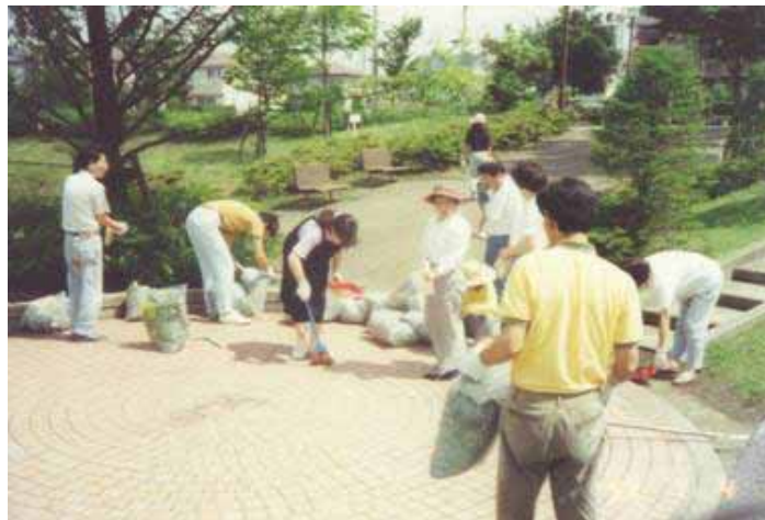
H5年の防災訓練の 前に中央公園の 清掃を実施中