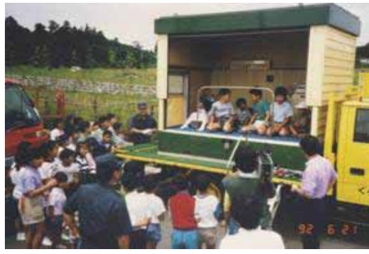
H4年の町会主催防災訓練