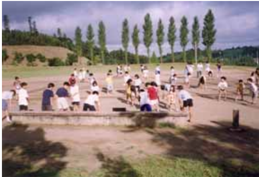
H10.7 夏休みラジオ体操 子供が元気なのは今も同じですね