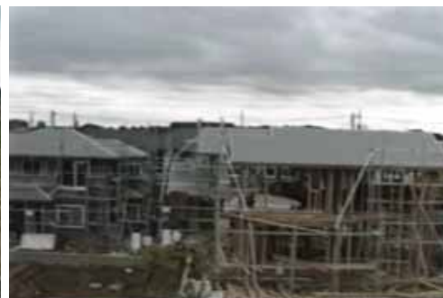
3丁目建築中の住宅