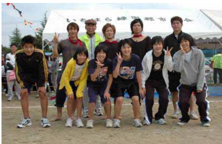
市民体育祭V2を達成した若い力