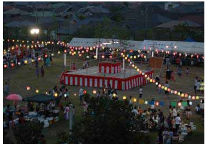
夏祭りをとおして醸成する「ふるさと」作り

S62から入居が始まった「いちほら緑園都市」は今成熟期を迎え更なる発展をして行く事と思います。この町で育った子供たちが、この町に愛着を感じ、やがては我々の残した住環境を引き継いでいくことを祈念します。皆様も是非街づくり活動に参加し、この町に居住することが誇りに思えるようにしようではありませんか。