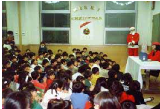
H3.12のクリスマス会 子供の数がすごいです