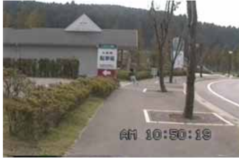
当時の現地販売所