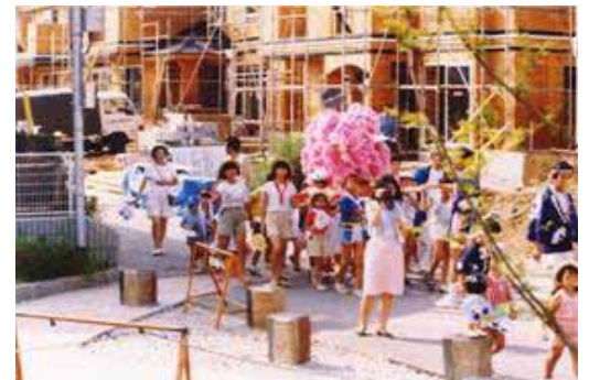
H2年の子供神輿 4丁目建設中横を練り歩き 手作りですね