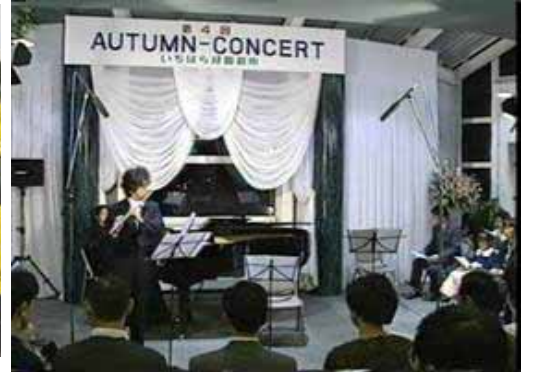
H5年のオータムコンサート ケーブルTVビデオより