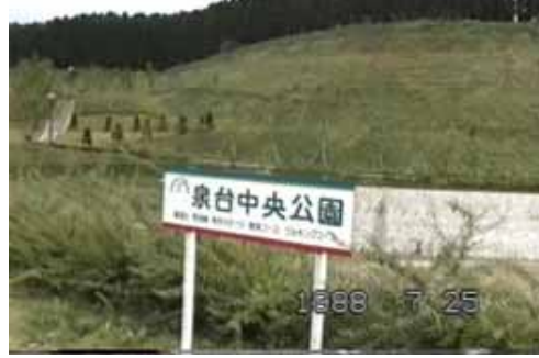
当時の泉台中央公園